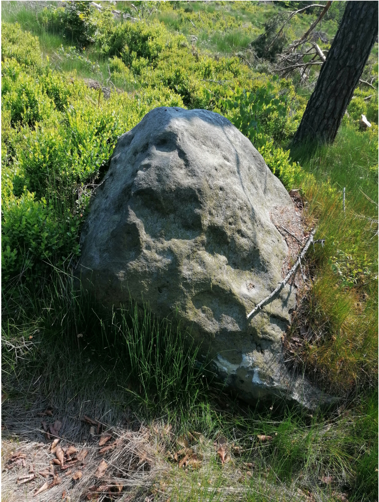
Obrázek č. 1/2