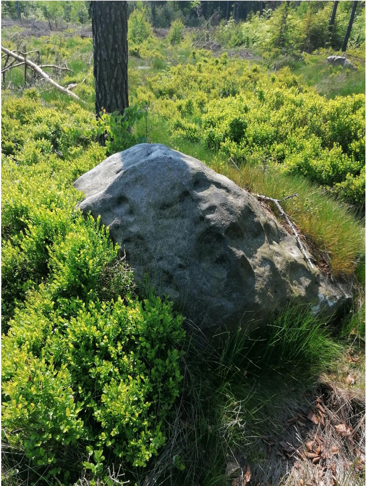
Obrázek č. 1/1